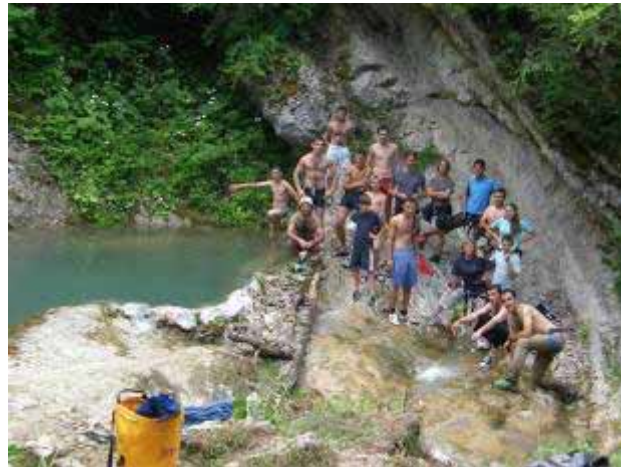
Au canyon de Znaqua avec les jeunes du villages.