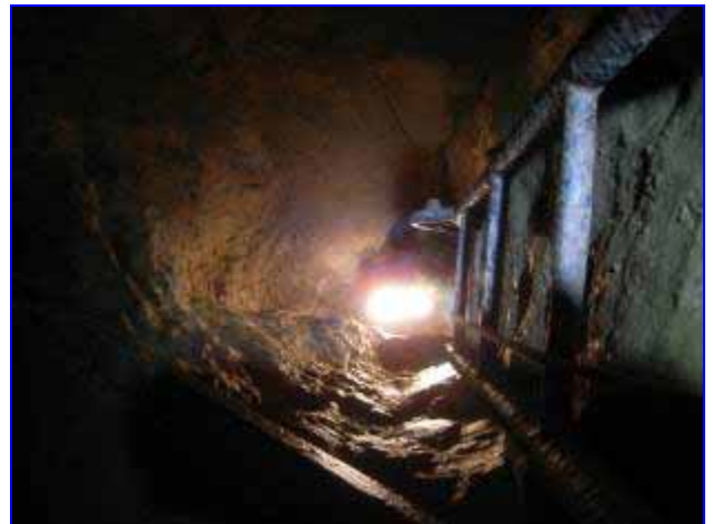
En haut du P93, au niveau de l'échelle

d'entrée puis un petit P6, ensuite vient le P93 plein gaz (équipé en double pour l'occasion, encore une bonne idée ça...) et ça continue, encore et encore (du ressaut en veux tu en voilà, du P15 et c'est reparti...). La descente se veut fluide et sans anicroche (merci à l'EFS pour le prêt de matos d'ailleurs).