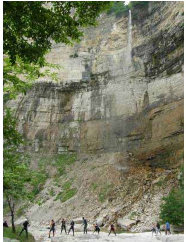
Au pied de la C115, on tente de récupérer la corde coincée à l'aide de tous les enfants (B. ABDILLA)